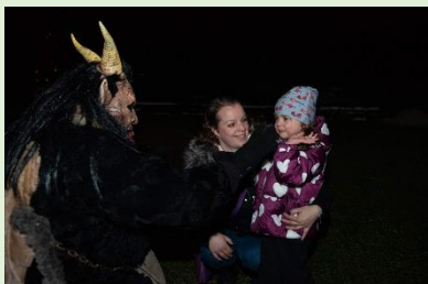
Peklo v Lomíčku – PS Hradec Masopust