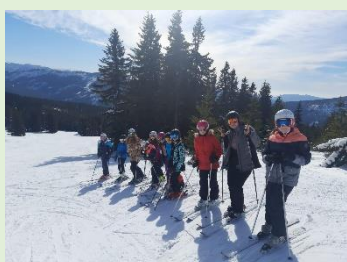
Jarní prázdniny v Krkonoších – PS Divoká Orlice Horní Bříza