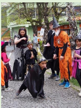
Slet čarodějnic – PS Safír Kdyně Víkendovka na Orlovicích