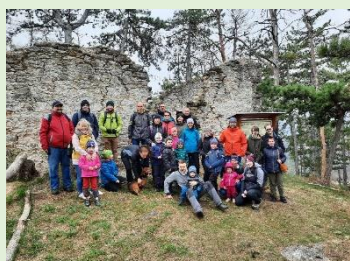
Jarní výprava – PS Prácheň Horažďovice