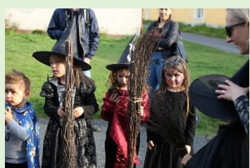
Slet čarodějnic – PS Dobřany Výlet do ZOO Praha