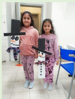
Rukodělky – PS Jitřenka Kdyně