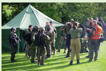
Republikové setkání airsoftových oddílů 2022 – PS Mír Domažlice