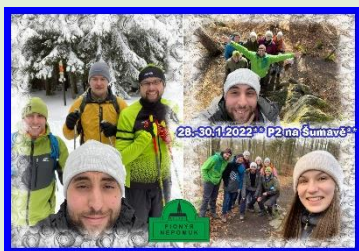
Zima na Šumavě – PS Nepomuk