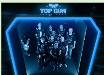
Laser game – PS des. St. Roubala Habartov Velikonoční bystřina

Snad každá fungující pionýrská skupina má nějakou svou tradiční akci, do které zapojuje děti i mládež z okolí. Všude jsou oblíbené například čarodějnice, pohádkové lesy, mikulášské nadílky, ale řada skupin či oddílů chystá i méně rozšířené akce jako třeba jarmarky, bály, kuličkády a drakiády. Hlavně se svými členy potom vyrážíme na výlety, víkendovky, přespání, puťáky, závody i stezky.