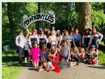
Pohádkový les – PS Otava Sušice